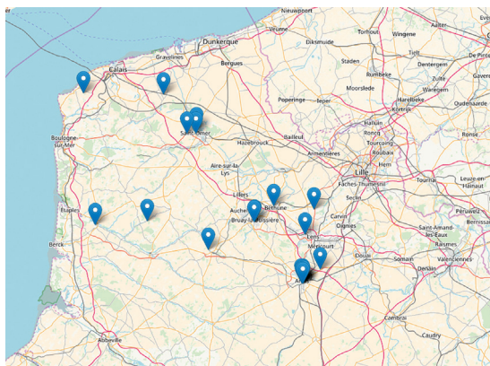
Carte des projets accompagnés par Propulsons! !

Depuis son lancement en novembre 2015, Propulsons! a accompagné 21 projets solidaires et/ou de proximité et créateurs d'emplois dans le Pas-de-Calais.