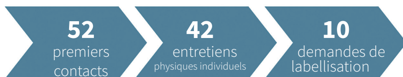
Concrétisation des prises de contacts en projets lancés

D'octobre 2016 à septembre 2017, 52 porteurs de projets ont pris contact, 42 premiers contacts ont été réalisés donnant suite à 10 demandes de labellisation .